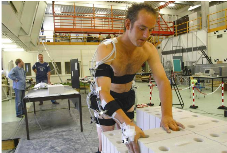
Imagen 3. Un estudio de laboratorio que mide la carga biomecánica sobre la parte inferior de la espalda en base a los datos sobre el peso del objeto y la postura corporal y los movimientos.