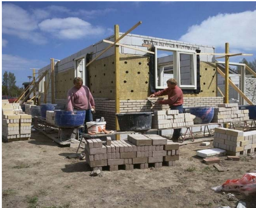
Imagen 2. Albañiles trabajando.

La manipulación de ladrillos que pesan menos de 5 kg o más de 10 kg representa un 4% y un 7% de la jornada laboral respectivamente. La mayor parte del tiempo de trabajo (57-77%) lo pasan erguidos. Un albañil pasa un 55% del tiempo de trabajo en una postura moderadamente agravante. Arrodillarse o acuclillarse ocupa más de un 4% del tiempo de trabajo (Boschman et al. 2010).